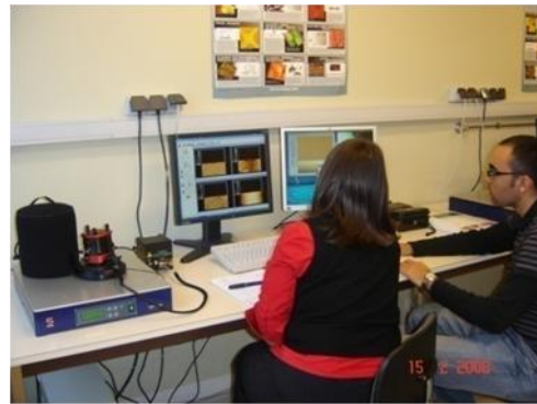
Figure 1 : Photographies de la plateforme AFM de l'AIME Micro-Nano de Toulouse

Cette plateforme pédagogique, entièrement dédiée à la formation pratique en microscopie à sonde locale, a officiellement démarré en octobre 2007. Elle est constituée de trois AFM di-Caliber de Veeco Instruments permettant de réaliser à l'échelle nanométrique :